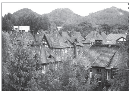
Familoki – zabytkowe osiedle patronackie kopalni „Dębieńsko” w Czerwionce-Leszczynach