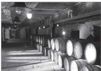
Browar Zamkowy Cieszyn

Początkowo Szlak Zabytków Techniki składał się z 29 obiektów. W ciągu dekady do sieci dołączyło 11, a 4 zostały wykluczone. Dziś jest ich 36, jednak od 1 stycznia 2017 r. liczba ta znowu wzrośnie. Szlak tworzyć będą aż 42 obiekty. Do Szlaku dołączają: