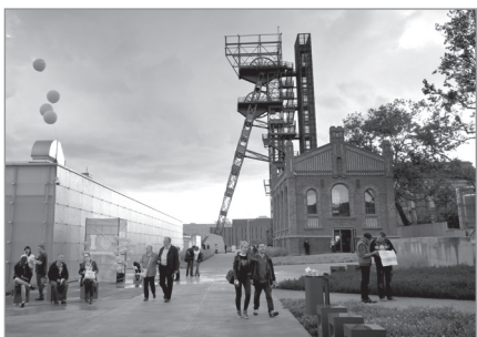
Muzeum Śląskie w Katowicach