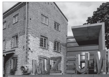
Muzeum Dawnych Rzemiosł w Starym Młynie w Żarkach

— Jakość pamięta się o wiele dłużej niż każdy inny element oferty. Do Szlaku dołączy 6 obiektów znakomicie wykorzystujących dziedzictwo przemysłowe dla potrzeb turystyki i kultury. Posiadają odpowiednią infrastrukturę oraz w pełni gotową ofertę dla szerokiego grona odbiorców. Możemy być pewni, że znacząco wzmocnią ofertę Szlaku. Dodatkowo nasza współpraca z nimi przetestowana została podczas INDUSTRIADY. Jednocześnie z żalem przyjąłem brak jakiegokolwiek odpowiedzi czy też kontaktu ze strony spółki Rezonator, nowego właściciela EC Szombierki w Bytomiu . Mimo pisemnej oferty