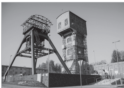
Zabytkowe wieże wyciągowe dawnej kopalni „Polska” w Świętochłowicach